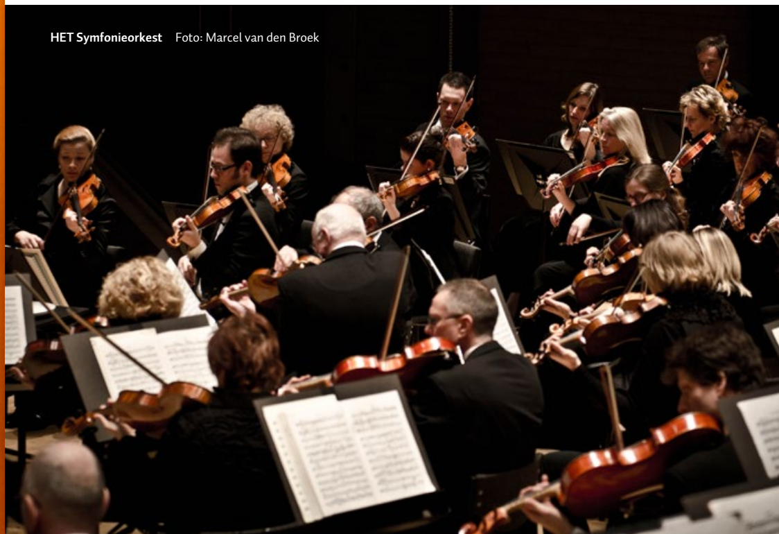
HET Symfonieorkest