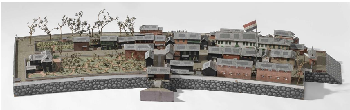
Maquette van het eiland Deshima, anoniem, 1850 - 1851 – permanent tentoongesteld in het Rijksmuseum Amsterdam

De historische locatie van Deshima ligt niet meer in zee, maar is door landaanwinning ingekapseld in de stedelijke bebouwing van Nagasaki. In de afgelopen decennia zijn delen van de handelspost in hun oude glorie hersteld en voor publiek opengesteld. Men koos voor de periode rond 1820-30, vooral omdat van die tijd goede documentatie beschikbaar is. Hoe dat alles in zijn werk ging en uitpakte - plus de plannen voor de toekomst, is het onderwerp van deze lezing.