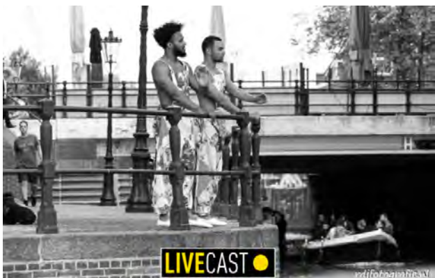
3 Digitale transformatie in internationale culturele relaties. LIVECAST Infected Cities 'COVID-19 and BIPOC communities' in samenwerking met Pakhuis de Zwijger.