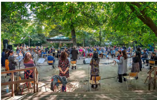
1 Culturele waarden en Europa. Forum on European Culture 2020, 'The Suppliants' bij de Tolhuistuin.