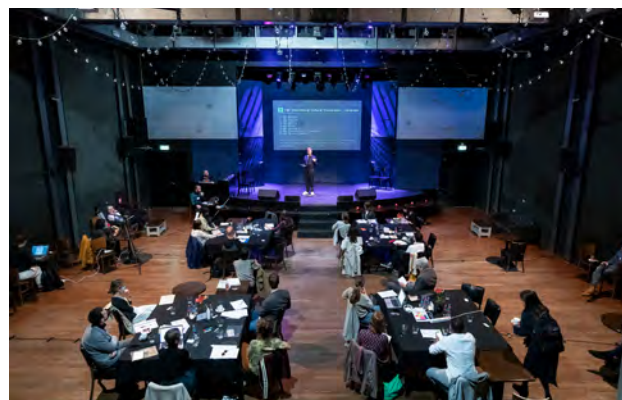
4 Fair cultural cooperation in internationale relaties. Event Fair International Cultural Cooperation – Language.