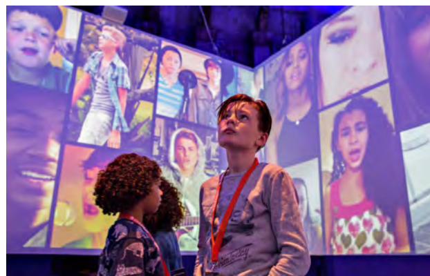
2 New Generations. Congres Kinder-cultuur 2019, foto: Cinekid.